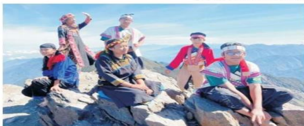
第一所部落實驗國中，巴楠花中小學從土地書寫，誕生全國第一名寫作滿級分學生。

第一所部落實驗國中 高雄巴楠花中小學從土地書寫 誕生第一名寫作滿級分學生 【記者陳雯萍高雄報導】